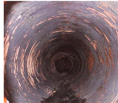
Resultat efter afrensning med en tankrenser

For at opnå dette har mange firmaer skiftet over til anvendelse af højtryksspuling som den primære metode til fjernelse af slagger. Dette gælder specielt i Australien, hvor alle alumina raffinaderier enten beskæftiger specialist entreprenører eller har deres eget højtryksudstyr. Det er ofte en kombination.