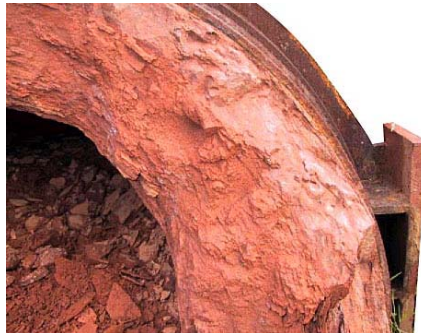
Kraftig belægning i procesrør

forhindre et fuldstændigt produktionsstop. Ordet rengøring er sikkert ikke det rigtige for et arbejde, der mere har karakter af nedbrydning. Slaggerne i disse raffinaderier er stenhårde og kan bedst sammenlignes med en klasse 500 N afhærdet beton, så det er ikke noget, man bare lige afrenser eller rengører. Traditionelle metoder såsom trykluftværktøj og dynamit er arbejdskrævende, farlig, beskidt arbejde og meget tidskrævende. Det er heller ikke særlig godt for produktionsudstyret.